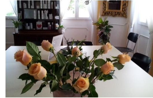
Bildquelle: Bella Vita Academy Schulungsraum